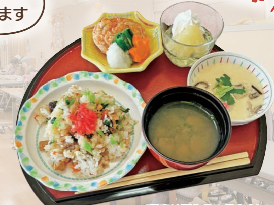
[写真は誕生日の行事食]