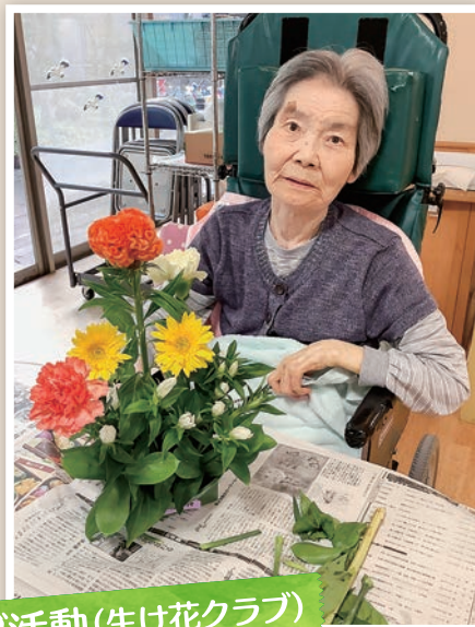
クラブ活動(生け花クラブ)

その方らしい健康で豊かな生活を安心して送れるよう、 『家族との面会』、『季節行事の開催』、 『機能に合わせた訓練の実施』、 『趣味、嗜好を取り入れた生活づくりの実現』、 『日常の健康管理』等を サービスに反映し、生活支援を提供します。