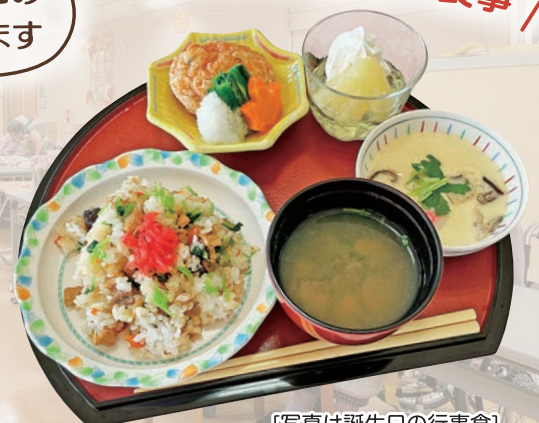
[写真は誕生日の行事食]